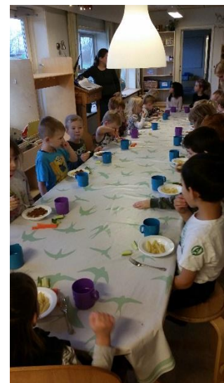
billeder fra maddag 29 januar 2016